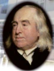
ジェレミ・ベンサム